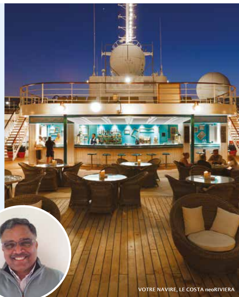
VOTRE NAVIRE, LE COSTA neoRIVIERA